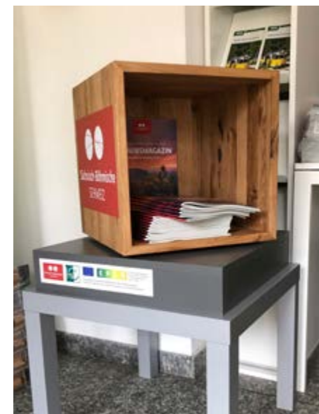
Der neue Würfel in der Touristinformation Sebnitz

Wer ebenfalls Interesse an dem Würfel hat, kann diesen für ca. 350 EUR über den TVSSW bestellen. Das Projekt wurde umgesetzt im Rahmen eines LEADER-Förderprojektes.