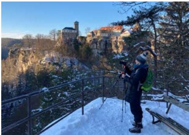
Winterliches Fotoshooting in Hohnstein

Der viele und langanhaltende Schnee hat uns in diesem Winter in die Marketing-Karten gespielt. Wir hatten ausreichend viel Zeit, um für die kommende Wintersaison Videoclips für einen digitalen Adventskalender zu drehen. Dabei sollen sich 24 Türchen zu tollen Winterangeboten in unserer Region öffnen. Wir hatten spannende Drehtage und haben einen ganz neuen Blickwinkel für die Bedeutung von Türen in der Sächsischen Schweiz gewonnen.