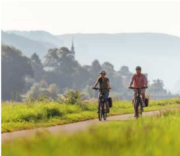
Unterwegs auf dem Elberadweg

Zu verdanken sei der Erfolg jedoch auch dem starken Netzwerk, das den Elberadweg trägt. „Der Elberadweg ist mehr als eine gut ausgebaute Strecke durch grandiose Landschaften. Erst die engagierten Partner entlang des Weges, die Gastgeber, Städte und Gemeinden, Tourismusverbände und alle weiteren Mitstreiter machen den Elberadweg zu einem derart starken Produkt“, so Grunow.