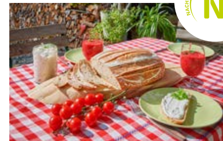
Regionale Produkte gibt es jetzt auch auf Wanderungen.

Ja, die Welt ist im steten Wandel und wer es schafft, sich mit zu verändern und vorauszu-denken, der bleibt bestehen. Veränderte Werte in der Gesellschaft, Umweltprobleme, Klimawandel – all das und noch viel mehr treiben den Veränderungsprozess an. Ein nachhaltiger Tourismus ist flexibel, krisensicherer und zukunftsorientiert - ein Weg also, um mit dem Veränderungsprozess gut umzugehen. Wir haben schon vor einigen Jahren begonnen, den Weg zu skizzieren und anzulegen. Nun ist es Zeit, dass sich die gesamte Region aufmacht und ihn beschreitet. Die ersten Unternehmen sind bereits an unserer Seite. So zum Beispiel das Hotel Elbresidenz in Bad Schandau, welches im vergangenen Jahr mit dem Green Sign – Zertifikat ausgezeichnet wurde. Oder die Jungunternehmerin von BrotZeitTours. Sie bietet bei ihren geführten Wanderungen rund um den Nationalpark nur regionale Produkte von ihren Partnern an. Mit all den Geschichten, die dazu gehören. Und natürlich wollen wir das Bio- und Nationalparkrefugium Schmilka nicht vergessen, welches schon seit