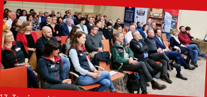
17. Tourismusbörse im Nationalparkzentrum Bad Schandau