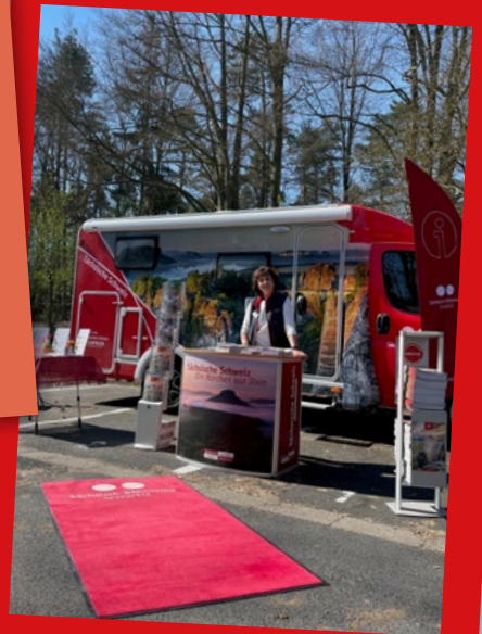
PopUp-Touristinformation an der Bastei