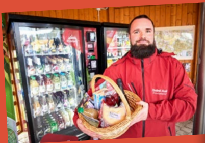
Einweihung des ersten Proviantomaten im Kurort Rathen