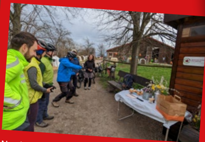
Nachhaltigkeitstage in der Sächsischen Schweiz