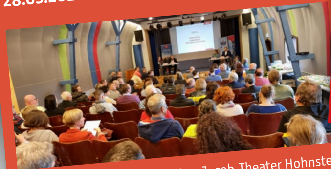
Mitgliederversammlung im Max-Jacob-Theater Hohnstein