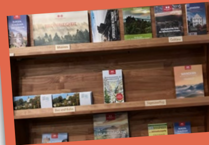
Verlosung der Prospektregale Die Gewinner sind: Aktiv Sporthotel, Pirna, Aktiv-Hotel Stock & Stein, Königstein Hotel „Zur Post“, Pirna